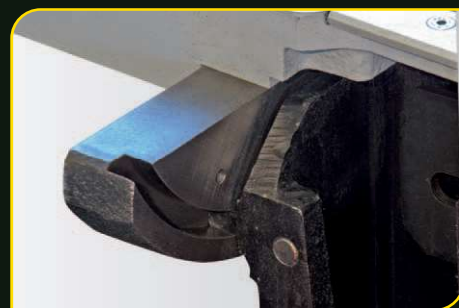
Masivní uložení mechaniky pily