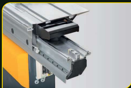
Formátovací stůl CV 400T