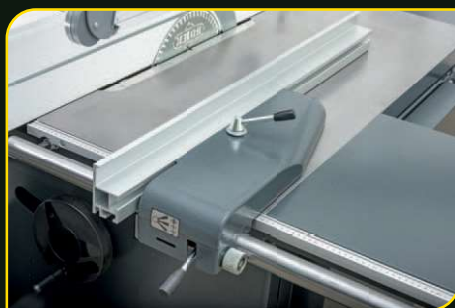
Podélné pravítko s jemným doladěním