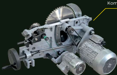
Kompletní díl mechaniky + předřez 0,75 kW