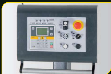
Horní ovládací panel