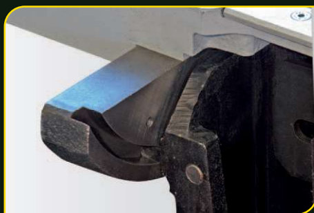
Masivní uložení mechaniky pily