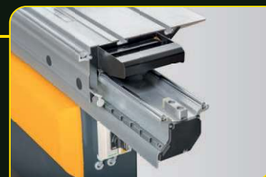
Formátovací stůl CV 400T