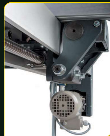
Motorický posuv podélného pravítka NC 3 osy