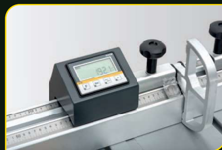
Doraz s digitálním odečítáním