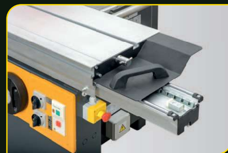
Formátovací stůl CV 360T