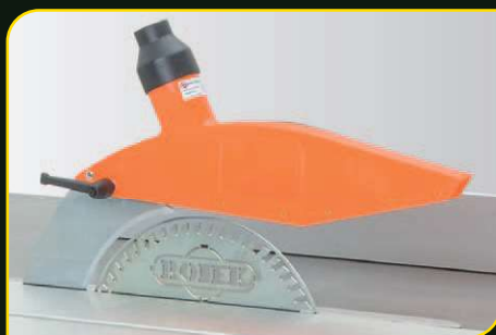
Kryt kotouče na klínu