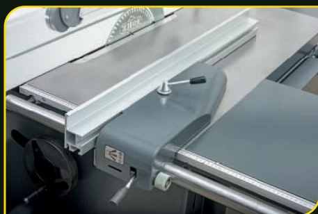
Podélné pravítko s jemným doladěním